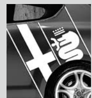
Alfa Romeo Logo auf der Seite