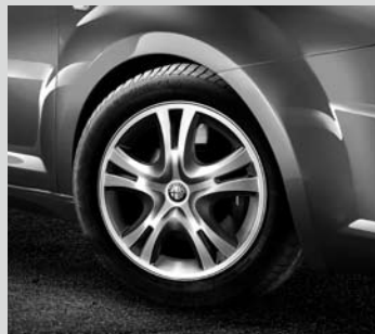
Leichtmetallräder „Elegante“, 7J x 16", mit Bereifung 195/55