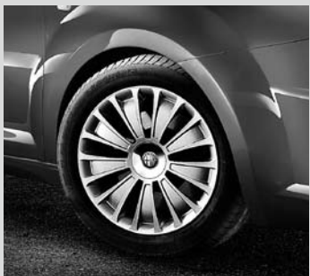
Stahlräder mit Radvollabdeckung, 7J x 16", mit Bereifung 195/55, serienmäßig für Version MiTo