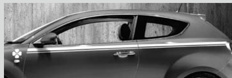
Quadrifoglio-Logo und Streifen auf der Seite