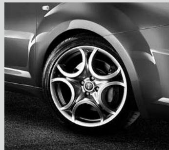
Leichtmetallräder „Sport I“, 7J x 17", mit Bereifung 215/45