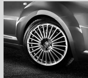
Leichtmetallräder „Elegante I“, 7J x 17", mit Bereifung 205/45