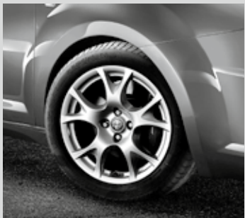
Leichtmetallräder „Sport“, 7J x 16", mit Bereifung 195/55