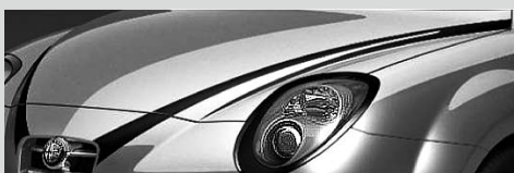
V über der Motorhaube