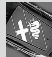
Alfa Romeo Logo auf dem Dach