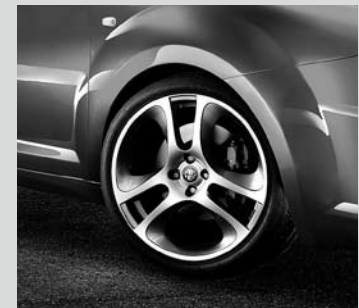
Leichtmetallräder „Supersport“, 7,5J x 18", mit Bereifung 215/40